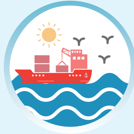
Transport de marchandises