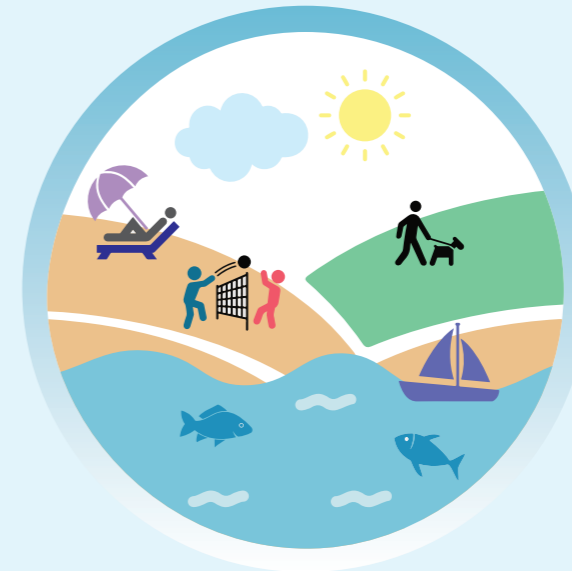
Tourisme et loisir