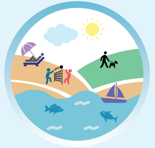
Tourisme et loisir