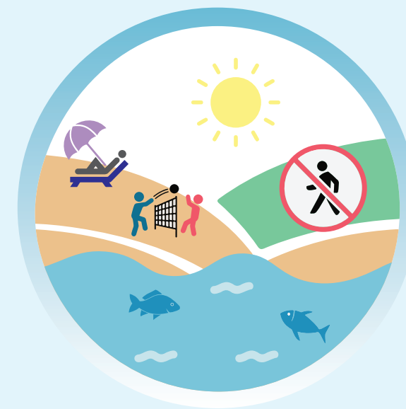
Limitation de l'accès aux espaces littoraux fragiles