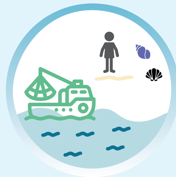
Avenir des pêcheurs et de l'aquaculture