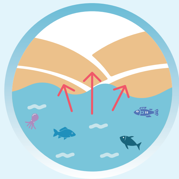
Réponse au recul du trait de côte