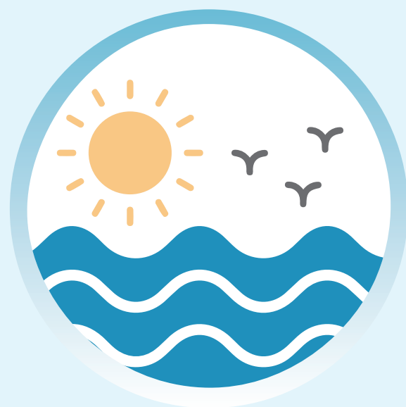
Etat écologique actuel du littoral