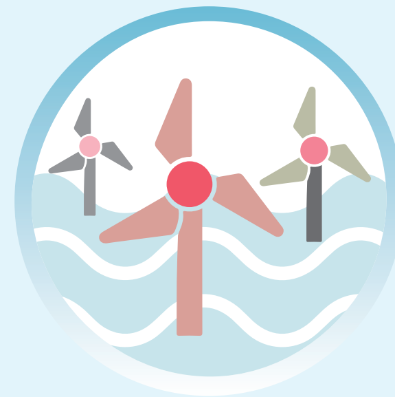
Eolien en mer et conséquences